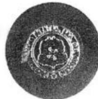
El Director de la Facultad